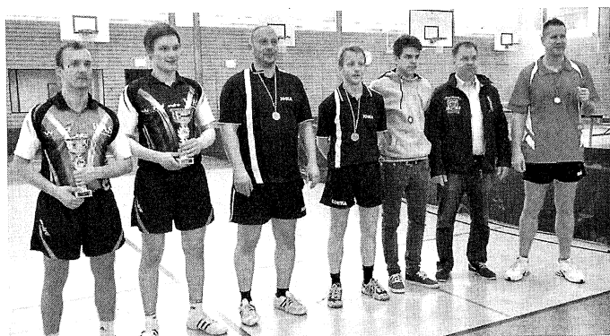
Sieger und Platzierte der Herren beim Pomerania Cup 2013