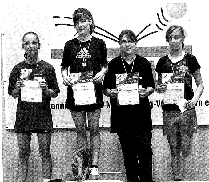
Die siegreichen Mädchen der AK 11/12