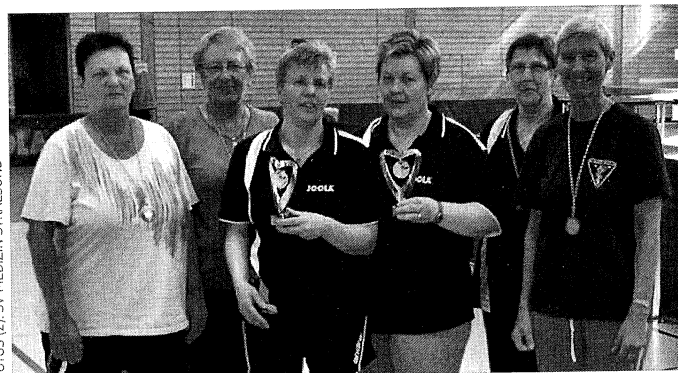
Pomerania Cup 2013: Sieger und Teilnehmer bei den Seniorinnen